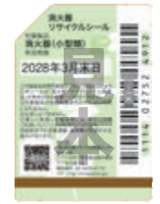
既販品用シール（見本）