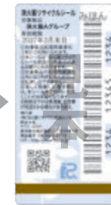
新品用シール（見本）

製品にはリサイクルシールが貼られています。消火器の使用期限が過ぎたら、取り扱い窓口へ引き渡してください。